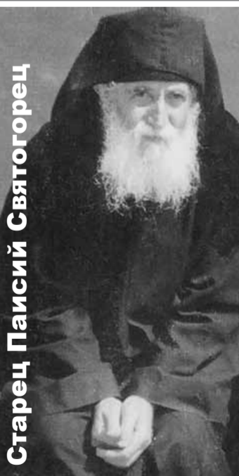
Старец Паисий Святогорец