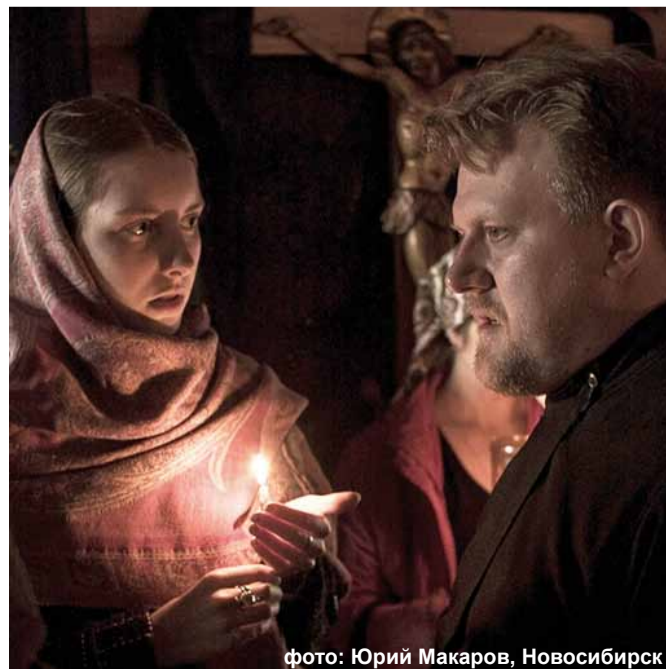
фото: Юрий Макаров, Новосибирск

ки из квартиры я не вижу никаких оснований религиозного характера. А вот вспомнить в этой связи слова писателя христианина Экзюпери о том, что ...мы в ответе за тех, кого приручили, думаю, будет вполне уместно.