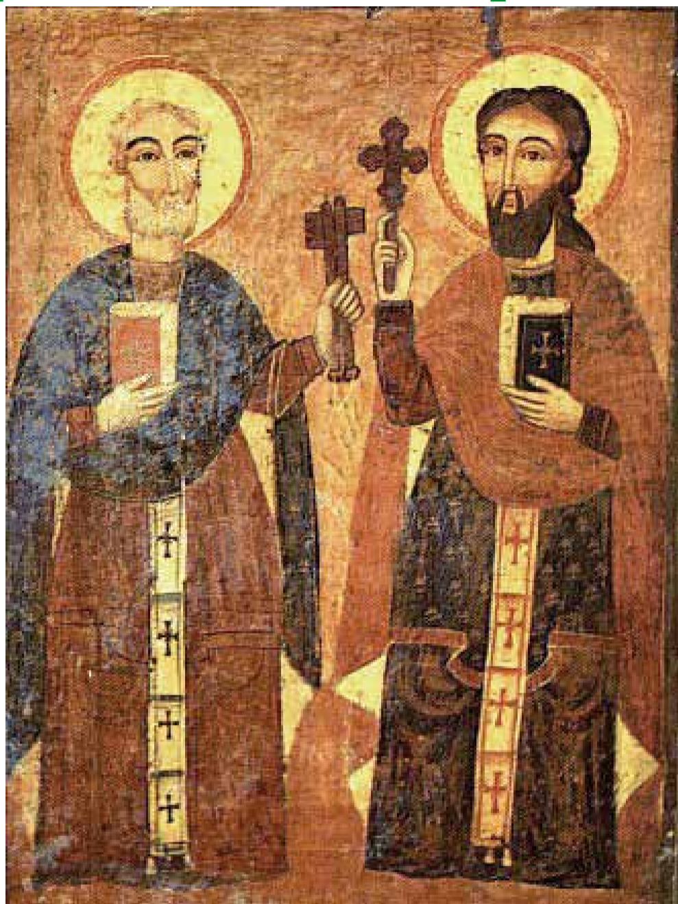
Апостолы Петр и Павел. Эль - Греко (Доменико Теотокопули)

В Православной Церкви утвердилось приготовление благочестивых христиан к этому празднику постом и молитвой.