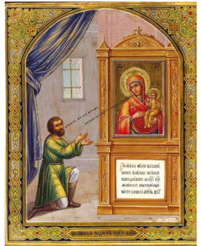
Икона Божией Матери «Нечаянная радость»

годной до последних дней. Это событие и дало верующим повод к написанию иконы Божией Матери «Нечаянная Радость». Икона, в которой так ярко запечатлелись чаяния народа на милосердное заступничество и помощь Пресвятой Богородицы, была всегда чтима в России. И в наши дни православные люди в теплой сердечной молитве к ней получают утешение в скорбях и бедах.