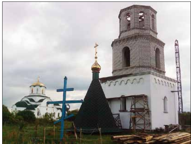
на фото: новая колокольня находится рядом с храмом.

На фотографиях представлены заключительные моменты установки восьмигранной крыши,