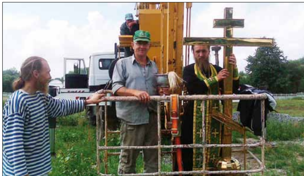
на фото: для освящения купола с установленным крестом, пришлось подняться наверх.

позолоченного купола и накопленного креста, венчающего это здание.