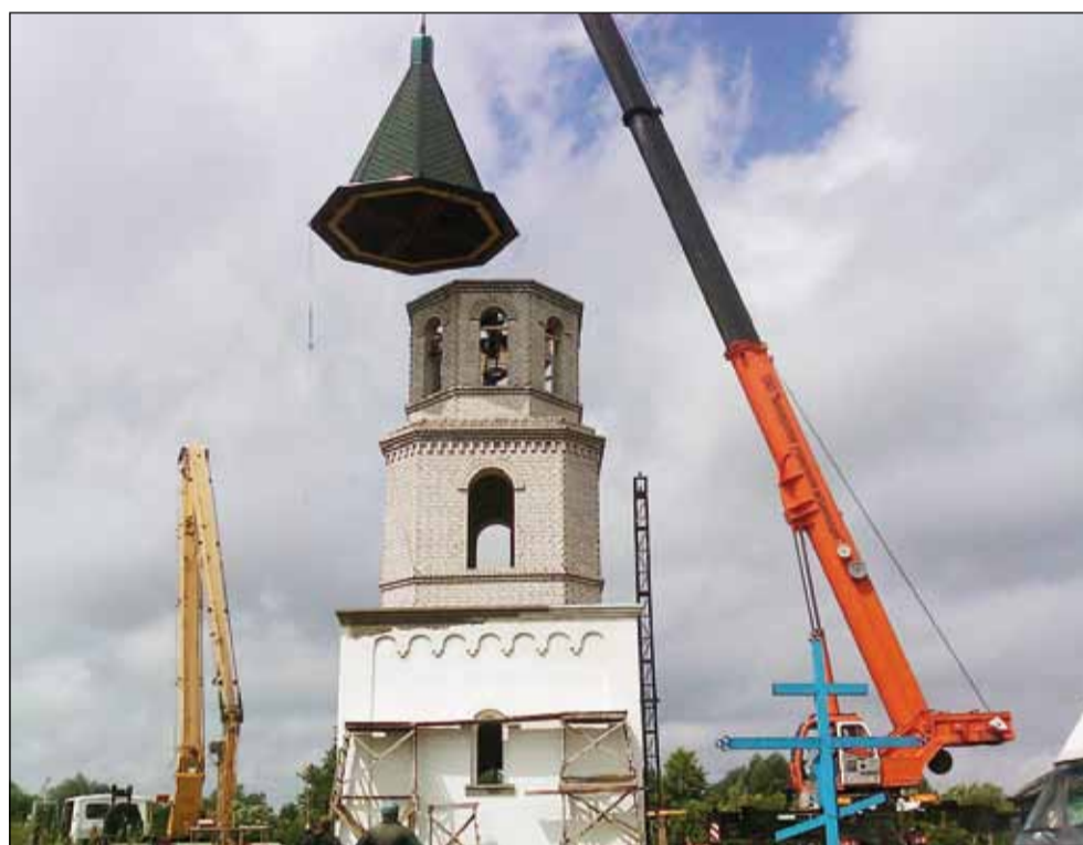
на фото: установка крыши колокольни.

колоколов различного размера и оборудовать специальный пульт звонаря. С помощью этого пульта, человек сможет управлять всем комплектом колоколов, создавая необходимую мелодию.