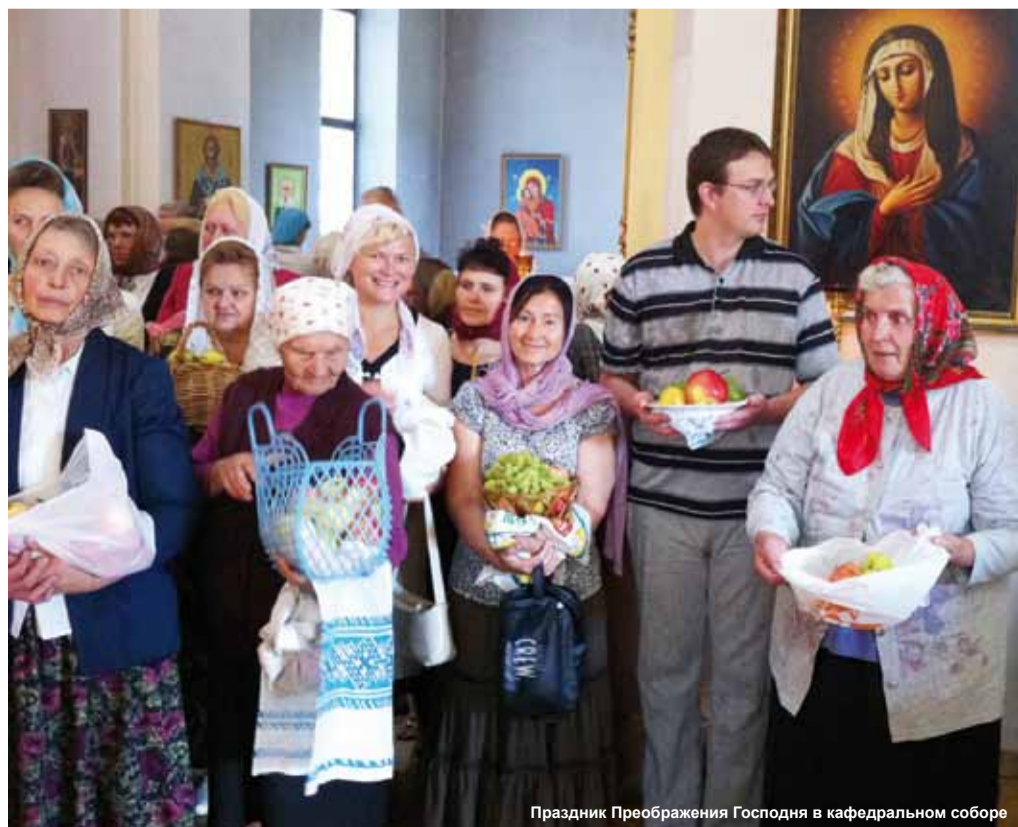
Праздник Преображения Господня в кафедральном соборе

Положительный настрой ребенку при подготовке уроков, конечно, необходим. И когда чрезмерно благочестивые родители внушают своему ребенку, что он никчемный и бездарный, а какие-то плоды его трудов — не более чем незаслуженное чудо, на мой взгляд, такие родители впадают в крайность. Другая крайность — такая вера в свои силы, при которой Бог становится не нужен. И наши способности, и наше здоровье, и судьба плодов нашего труда все-таки в Его руках.