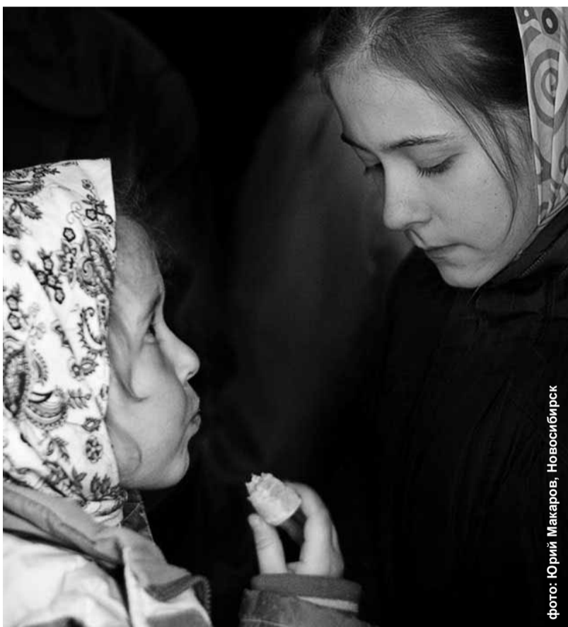
фото: Юрий Макаров, Новосибирск

Хочется. Чем больше молюсь — тем больше хочется. «Нет, — думаю. — Бог сверх меры испытаний не дает. Если мне можно этот пряник, Он мне его Сам пошлет. Умру, но не пойду брать». Вспоминаю,